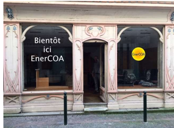
Le futur local d'EnerCOA situé 3 rue Prestat à Villefranche de Rouergue.

Actuellement hébergé dans les locaux d'Interactis, EnerCOA prendra bientôt ses quartiers au centre de Villefranche. Après une trentaine de visites (!), les administrateurs ont arrêté leur choix sur l'ancien atelier du célèbre sculpteur villefranchois Fernand Brassac, situé au 3 rue Prestat.