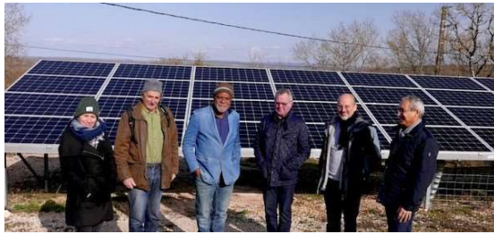
Le CoTech d'EnerCOA en visite sur la centrale photovoltaïque de CéléWatt (Bregues, Lot).

Sur le volet production d'énergies renouvelables, la commission technique, qui rassemble une dizaine de personnes, a été très active. Elle a tour à tour étudié les toitures les plus propices à accueillir un projet de centrale et pris connaissance du retour d'expériences des SCIC voisines sur ce type de projet.