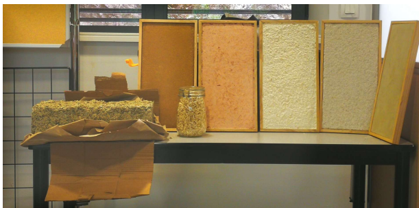
Echantillons d'isolants et d'enduits écologiques présentés par l'entreprise Ecohérence Habitat lors d'une réunion d'information d'EnerCOA

Odile Proust 06 73 67 56 45, Maïté Dautriche 06 56 75 70 91, référentes du groupe Réduire .