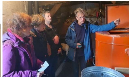
Photo d'une visite chez un coopérateur