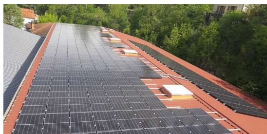
... Juin 2021 les panneaux sont aussi sur le toit du magasin du Centre Hospitalier Rue Cibiel !