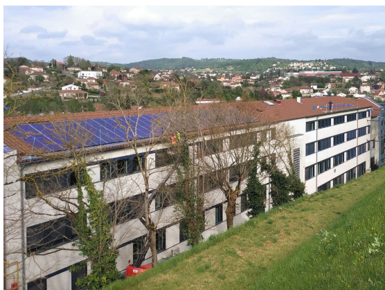
Fin avril 2021 pendant les travaux sur le bâtiment Interactis Chemin de 13 pierres...

10 coopérateurs constituent le premier groupement de commandes d'EnerCOA pour 10 centrales de 3 kWc prochainement installées avec les prix les plus justes constatés sur le marché. Notre partenaire est les Fermes de Figeac (merci à Sophie Tranchart, cheville ouvrière de ce projet et aux 4 étudiants de l'université d'Albi qui se sont investis).